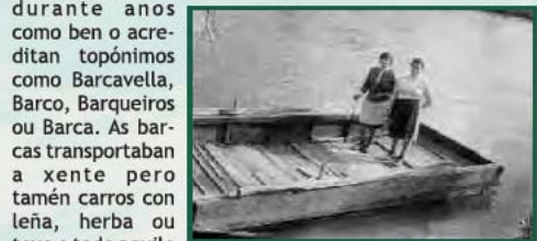
Veciñas na barca de Chaián a finais dos 60

Houbo varias barcas no Tambre e a última, a de Chaián traballou até 1972 polo que podemos dicir que foi unha das derradeiras de Galicia.